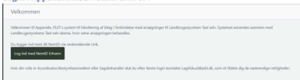
Skærbillede 8: Velkomstbillede

Tryk på knappen Log ind med NemID Erhverv og vælg derefter enten fanebladet: